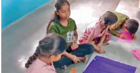
బిడ్డిపాచివనల్లో సమ్మర్ క్యాంప్ కొనసాగుతున్న దృశ్యం