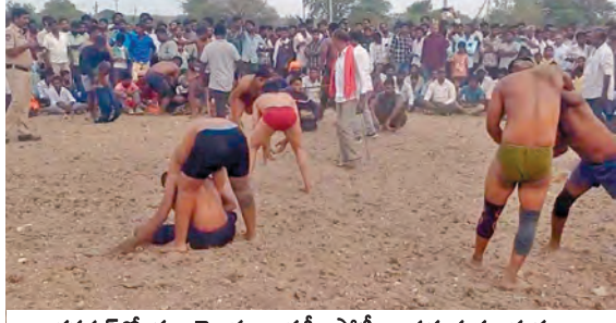
కడపలో మల్లయోధులు కుస్తీ పోటీలు వడుతున్న దృశ్యం

మండల పరిషత్లోని కడపలో కుస్తీ పోటీలు ఉత్సాహంగా కొనసాగాయి. కుస్తీ పోటీలను తిలకించేందుకు గ్రామస్థులతోపాటు పరిసర గ్రామాల నుంచి మల్లయోధులు తరలివచ్చి పోటీల్లో తమనాట బాటుకున్నారు. కుస్తీ పోటీల్లో ప్రతిభపాటిన మల్లయోధులకు బహుమతులు అందచేశారు.