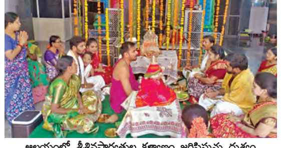
ఆలయంలో శ్రీశివపార్వతుల కళ్యాణం జరిపిస్తున్న దృశ్యం