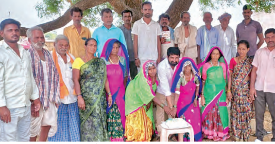
వారోత్సవ వేడుకలు జరుపుకుంటున్న గిరిజనులు

-గిరిజన సంక్షేమ సంఘం ఉమ్మడి మెడక్ జిల్లా అధ్యక్షులు