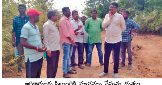
అధికారులు, సిబ్బందికి సూచనలు చేస్తున్న దృశ్యం

కొములపల్లి, మే 15, ప్రభాతవార్త: మండలపరిషత్లోని గొంపాలపల్లి, రాంసాగర్, రసూలాబాద్ గ్రామ పంచాయతీలో జరుగుతున్న ఉపాధిహామీ పథకం(ఈజిపిఎస్) పనులు, ధాన్యం కొనుగోలుకేంద్రాలను డిఆర్ డి పిడి జయదేవ్ ఆర్డీ శుక్రవారం పరిశీలించారు. గ్రామాల్లో జరుగుతున్న అభివృద్ధి కార్యక్రమాల పురోగతిని ప్రత్యేకంగా పరిశీలిస్తూ వార్షికంపాటు పలు సూచనలు చేశారు. గ్రామాల్లో చేపడుతున్న ఈజిపిఎస్ పనుల నాణ్యత, కార్యకలకుల అందుతున్న సౌకర్యాలు, పనులవేగం తదితర అంశాలపై సమీక్ష నిర్వహించారు. ధాన్యం కొనుగోలు, సేకరణ ప్రక్రియను పరిశీలించారు. కొనుగోలుకేంద్రాలలో రైతులకు ఎలాంటి ఇబ్బందులు రాకుండా తగుదర్యలు తీసుకోవాలని అధికారులను ఆదేశించారు. కార్యక్రమంలో ఎంపిడిఎస్, సర్పంచులు, ఈజిపిఎస్ సిబ్బంది పాల్గొన్నారు.